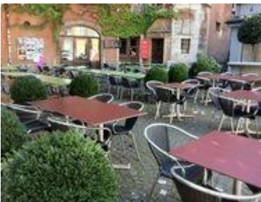
3) St-Gervais Untergasse 21, Tel. 032 322 48 22