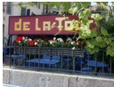
8) De la Tour Obergasse 33a, Tel. 032 322 00 64