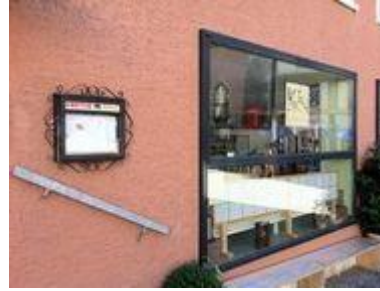
2) Sushi Nori Ogura rue du Bourg 2, Tel. 032 323 04 70