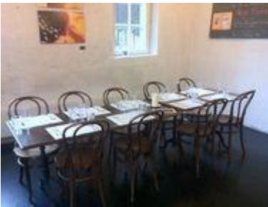
5) Les caves Obergasse 24, Tel. 032 322 36 34