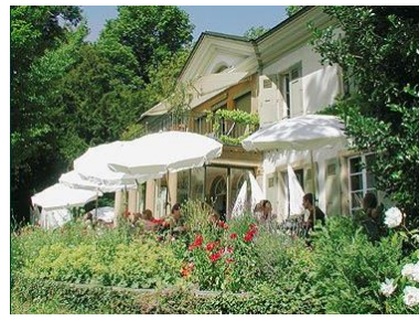
4) Villa Lindenegg Lindenegg 5, Tel. 032 322 94 66