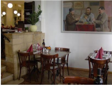
1) Pfauen Ring 7, Tel. 032 322 49 13