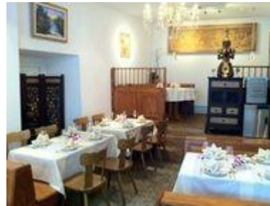
6) Zum Thailänder Brunngasse 4, Tel. 032 323 87 87